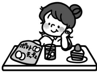
好きなものばかり 食べている子